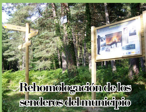
Rehomologación de los senderos del municipio