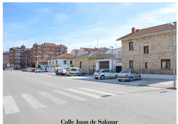
Calle Juan de Salazar