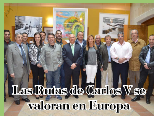
Las Rutas de Carlos V se valoran en Europa