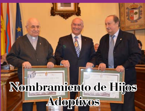
Nombramiento de Hijos Adoptivos