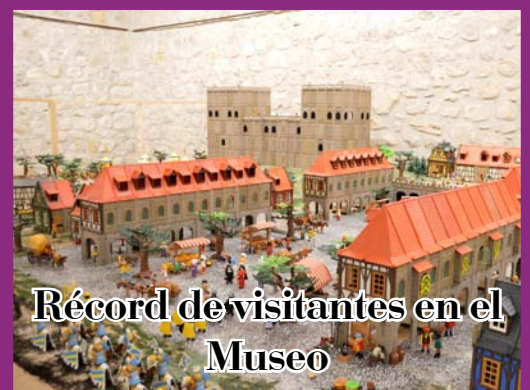
Récord de visitantes en el Museo