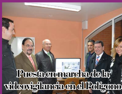
Puesta en marcha de la videovigilancia en el Polígono